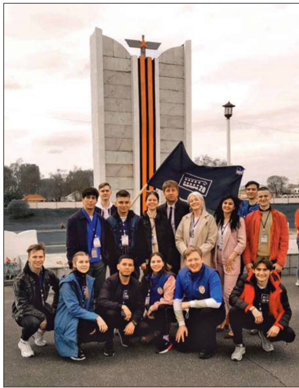
Лучшие активисты вузов Республики Беларусь и Российской Федерации собрались на XI открытом международном молодежном форуме «Я говорю «Да!» (здоровому образу жизни, мирному небу, творчеству, содружеству культур, диалогу поколений), который прошел в рамках работы Школы инновационного профессионального мышления с 5 по 7 мая в Барановичском государственном университете.

образу жизни, мирному небу, творчеству, содружеству культур, диалогу поколений), который прошел в рамках работы Школы инновационного профессионального мышления с 5 по 7 мая в Барановичском государственном университете.