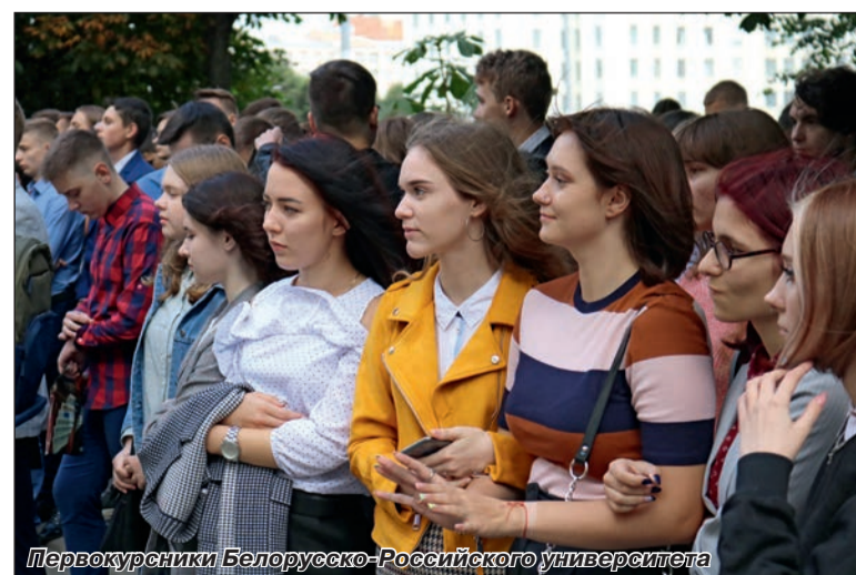
Первокурсники Белорусско-Российского университета