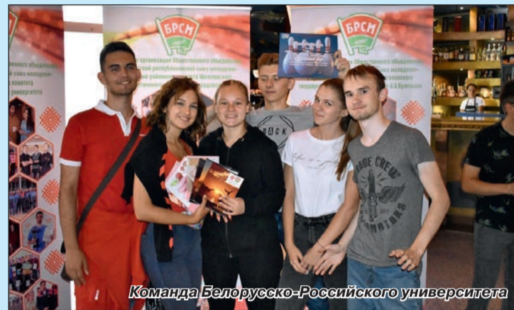
Команда Белорусско-Российского университета