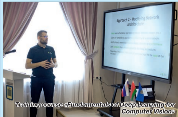
Training course «Fundamentals of Deep Learning for Computer Vision»

курс детского рисунка « Я рисую науку », на которую было заявлено более 400 работ, 123 из них вышли в финал. Победителями стали: