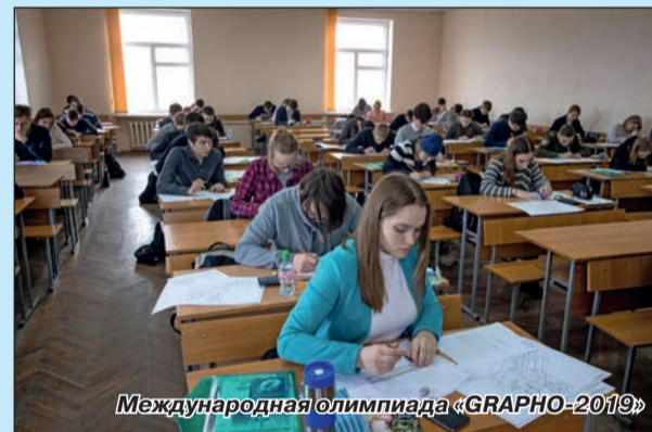
Международная олимпиада «GRAPHO-2019»

На Республиканском конкурсе педагогических проектов « ЕСТЬ ИДЕЯ! » были представлены работы по шести направлениям: