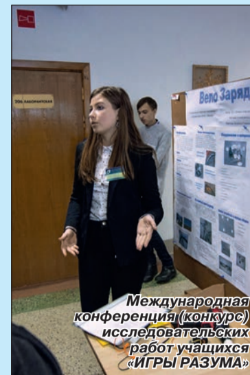
Международная конференция (конкурс) исследовательских работ учащихся «ИГРЫ РАЗУМА»

Более 60 обучающихся школ, гимназий и колледжей из Могилева, Костюкович и Калинкович участвовали в молодежном форуме « Маркетинг-NEXT ». Ребята состязались в творческом конкурсе «Битва креатива» и в игре-викторине «Брендомания». В перерыве между конкурсными мероприятиями прошла открытая лекция партнера Фестиваля ООО «Айтиландия» на тему «Профориентация школьников по востребованным направлениям IT-специальностей». По итогам конкурса 1-е место заняла коман-