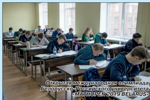
Открытая международная олимпиада Белорусско-Российского университета «MATHOPEN 2019 BELARUS»