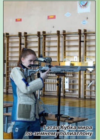
Этап Кубка мира по зимнему биатлону