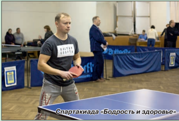
Спартакиада «Бодрость и здоровье»