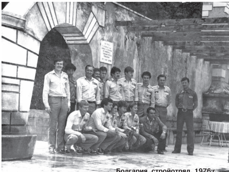
Болгария, стройотряд, 1976 г.

За инициативу в социалистическом соревновании ВЛКСМ был награжден в 1931 году орденом Трудового Красного Знамени.