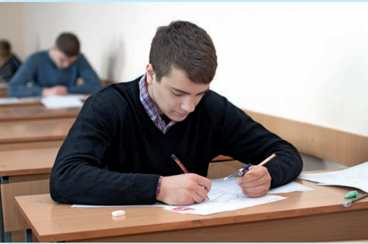
Во время олимпиады «GRAPHO-2018»

ме того, в программу форума вошли лекция-диспут на тему «Банковская система Республики