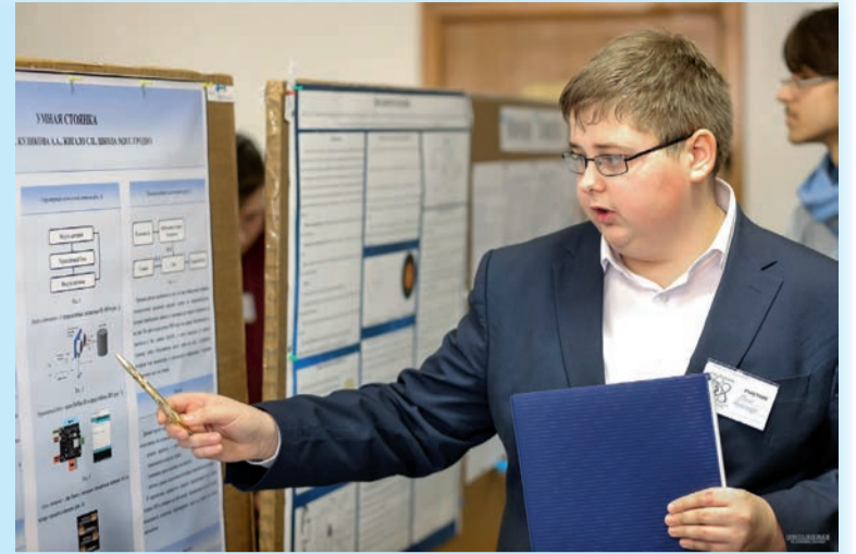
Во время конкурса «Игры Разума»

Начинающие программисты смогли испытать свои силы и