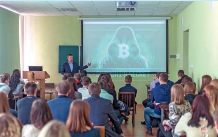
Лекция-диспут «Bitcoin. Правда и вымысел»

Беларусь в цифровой экономике» и мастер-класс «Управление личными финансами».