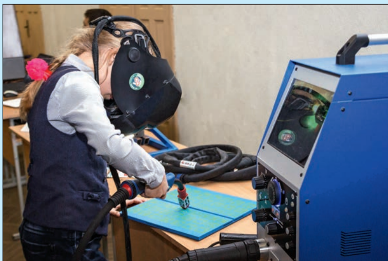
На выставке «Наука вчера и сегодня»

В рамках Финансового форума состоялась Олимпиада по финансовой грамотности, финансовому рынку и защите прав потребителей финансовых услуг, в которой приняли участие 60 школьников. Кро-