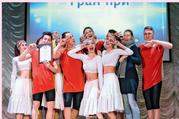
Обладатели Гран-при фестиваля

«Театр+». 27 хореографических постановок, 15 чтецов и 8 театральных миниатюр было представлено вниманию жюри и зрителя.