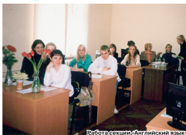
Работа секции «Английский язык (экономические специальности)»

С 20 по 24 мая в нашем университете проходила 44-я студенческая научно-техническая конференция. В конференции приняли участие 758 студентов, чьи 640 докладов были заслушаны на 39 секциях.