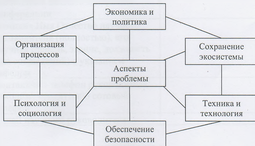
Рисунок 1 – Применение комплексного подхода к управлению

Схема применения комплексного подхода к управлению показана на рисунке 1. / На схеме применения комплексного подхода к управлению показано ... (рис. 1).