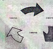
Рисунок 1. Взаимосвязь окружающей среды.....

В основе расчетов используется следующая формула: