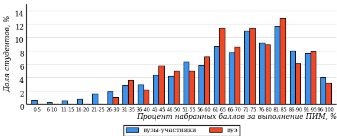
Рисунок 1.1 – Распределение результатов тестирования студентов вуза с наложением на общий результат вузов-участников

Результаты тестирования студентов вуза и вузов-участников в целом по показателю «Доля студентов по проценту набранных баллов за выполнение ПИМ» представлены на рисунке 1.1.